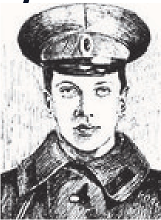
Николай Степанович Гумилев

«Словно молоты громовые / Или воды гневных морей, / Золотое сердце России / Мерно бьется в груди моей...» так в стихотворении «Наступление» 1916 года напишет о себе Николай Степанович Гумилев, поэт, разговор о котором в год столетия с начала Первой мировой войны кажется нам особенно уместным.