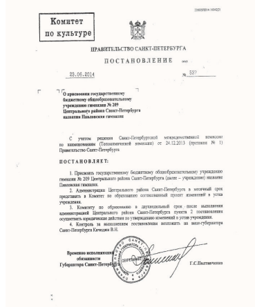
Документ о присвоении гимназии №209 названия «Павловская»