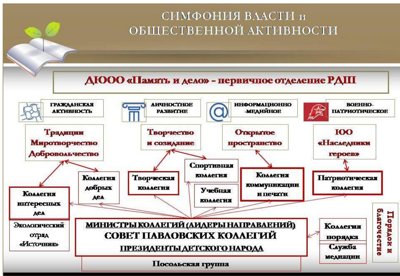
Схема внутренней организации детско-юношеской общественной организации «Память и дело», первичного отделения РДШ:

Каждому направлению Российского движения школьников соответствует смысловое направление ДЮОО «Память и дело»: