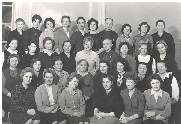
Педагогический коллектив 209-й школы. 27.12.1965 года.