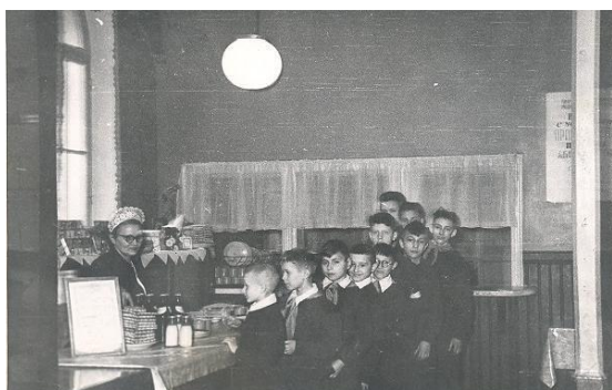
Школьная столовая. 1960 год.

Была огромная столовая с завтраками за 18 копеек и пирожками в ассортименте за 5 копеек.