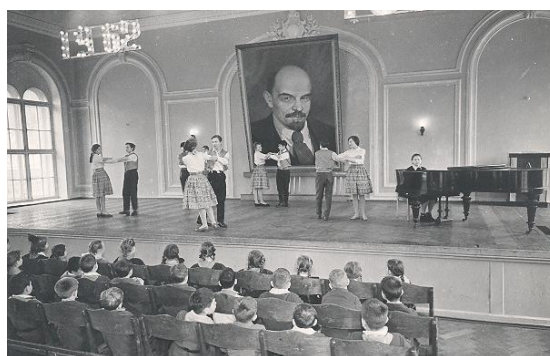
Школьный коллектив «Дружба». На новогоднем выступлении. 1962 год.

Проводились танцы, регулярные праздники. Всё это было в полном объёме. Было море кружков, масса секций. Из школы можно было не выходить, а если выходить, то только во двор. Всё было в школе вокруг неё. Дети не сидели по домам, не пропадали.