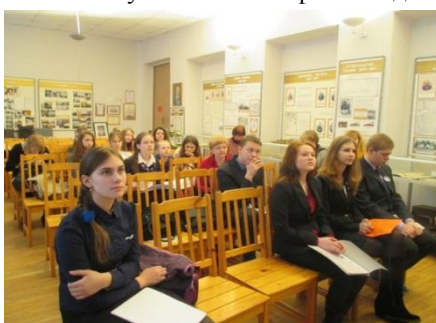
Работа секции «Школьное музееведение на ежегодной научно-исследовательской конференции «Павловские чтения»