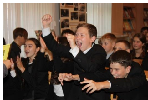
Подведение итогов культурно-исторической игры, посвященной 70-летию Великой Победы и 70-летию со дня окончания Второй мировой войны