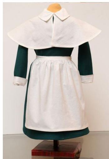
Макет формы воспитанницы Павловского института. Выполнен гимназистками на уроках труда. Зелёный цвет формы не случаен – в институт принимали дочерей военных. Цвет формы военных того времени – зелёный