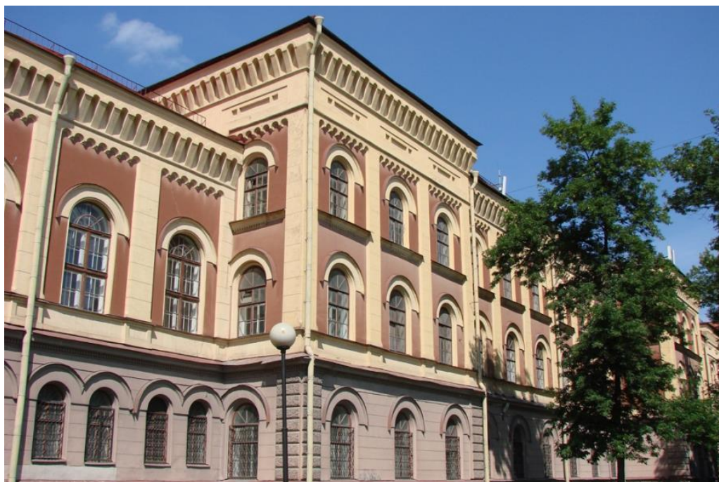
Здание гимназии № 209