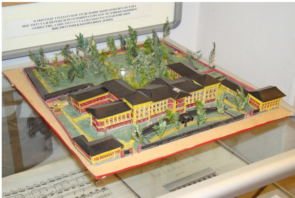
Макет здания Павловского института благородных девиц