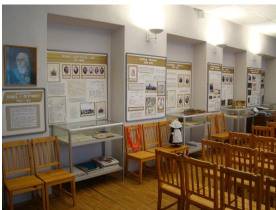
Музей истории гимназии

Кроме истории института в музее отражена история Института живого слова, учебных заведений межвоенного периода, эвакуационного госпиталя № 2015, располагавшегося в здании в период советско-финляндской и Великой Отечественной войн, 209-й школы и гимназии № 209. На данный момент фонд музея насчитывает около 300 экспонатов.