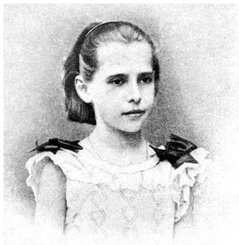
Лидия Чарская в 10-летнем возрасте

Одной из самых известных выпускниц Павловского института была детская писательница Лидия Чарская. Переступив порог здания в 1886 году, в 1893 году она окончила институт с золотой медалью, получив её из рук самой императрицы. Ещё во время учёбы она тщательно записывала самые интересные случаи, происходившие в стенах института. В начале XX века её воспоминания под названием «Записки институтки 4 » были опубликованы в журнале «Задуманное слово». Ценность этого произведения заключается в том, что оно является фактически единственным, в котором ярко и подробно описывается то, как учились и жили «павлушки». В школьном музее истории гимназии имеется полное собрание сочинений Л. Чарской. Её книги пользуются большим успехом у школьников, которые с интересом читают их, открывая для себя школьную жизнь воспитанниц института, учившихся в этих стенах более 150 лет назад.